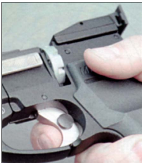
Рис. 6 Кнопочный предохранитель находится на спусковом крючке и во включённом состоянии блокирует спусковой крючок.

- внутренние раковины и микротрещины в корпусе заметить трудно, но всё-таки внимательно осмотрите тыльную часть рукоятки под накладкой, пространство вокруг затяжного болта и под барабаном. Корпус ломается чаще всего именно в этих местах, хотя случается такое очень редко;