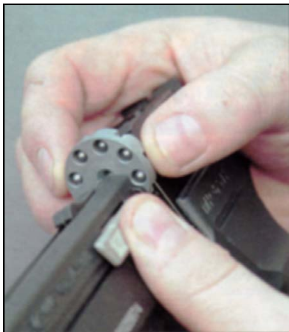
Рис. 4 Для свинцовых пуль и для стальных шариков используются разные барабаны, входящие в комплект поставки.

лик положительно сказываются на точности стрельбы из "651-го". Вместительный трубчатый магазин на 25 шариков и легко меняющийся барабан позволяют стрелять из пистолета, как шариками ВВ, так и пулями длиной до 7 мм. Неподвижный нарезной ствол длиной 145 мм, обеспечивает отличную кучность стрельбы, которой могут позавидовать многие западные образцы. Простейший, можно даже сказать примитивный спусковой механизм, надёжен сверх всякой меры – там просто нечему ломаться, все детали выполнены из хорошей стали и "посажены" опять же на стальные оси. Спуск при стрельбе самовзводом хотя и длинный (как во всех самовзводных системах), но плавный и мягкий, без рывков. Правильно подобранные характеристики спуска позволяют обращаться с пистолетом даже 8-летнему ребёнку.