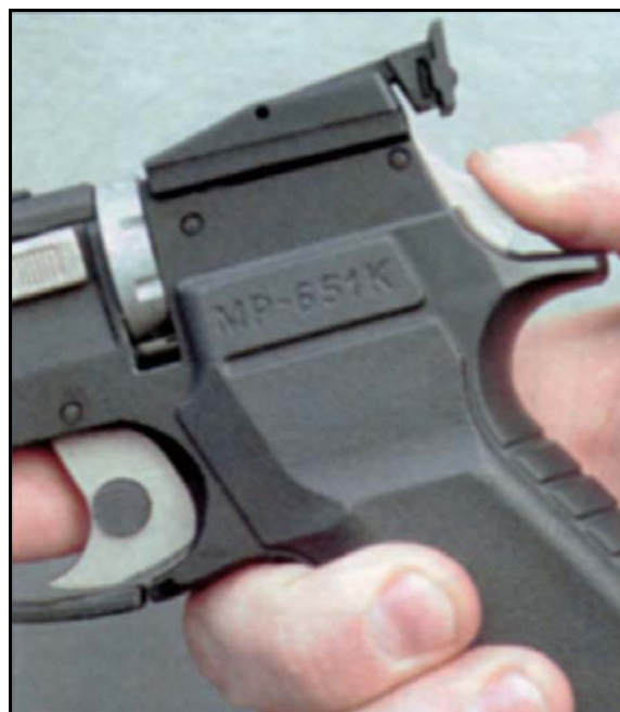
Рис. 7 Стрельбу из MP-651K можно вести как самовзводом, так и с предварительным взведением курка.

- шарики из магазина в барабан должны заходить свободно, без задержек и заедания;