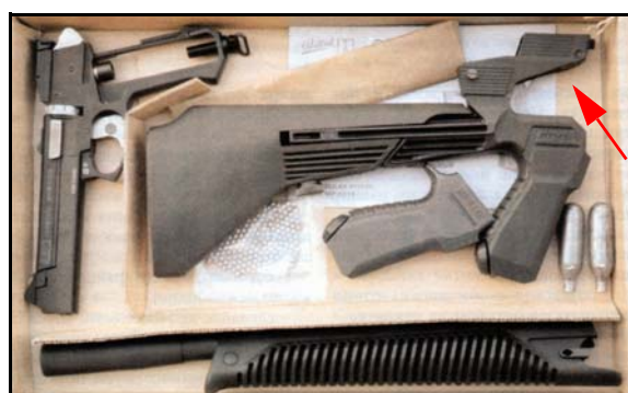
Рис. 9 Приобретение такого комплекта сделает вас обладателем и пневматического пистолета и его модификации с цевьем и прикладом, которую логичнее всего отнести к карабинам. Самая интересная деталь в этом комплекте - зеркальная приставка (отмечена красной стрелкой), позволяющая прицеливаться из оружия с помощью штатного прицельного приспособления пистолета.

В общем если вы остановили свой выбор на МР-651К, то на долгие годы получите надёжного партнёра для досуга, тренировок и снятия стресса, а при правильном уходе будете передавать его по наследству как семейную реликвию. Из него постреляют ещё ваши дети и внуки.