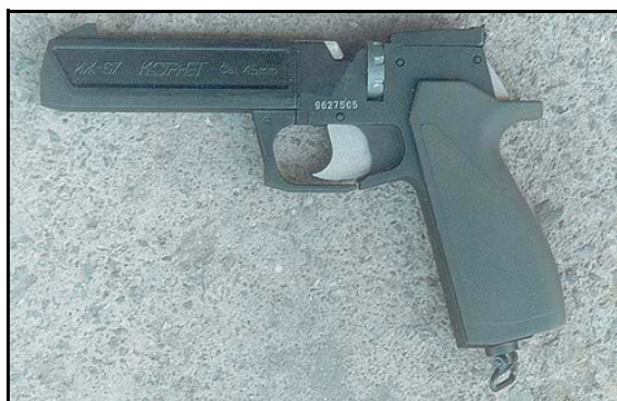
Рис. 2 Предшественник "651-ой" модели - пневматический пистолет "Корнет", в основном отличается от него отсутствием магазина для шариков, упрощённым целиком и рукояткой, для отделения которой была необходима отвёртка.

Спортивный пистолет ни к чему, хотя и точность, и кучность — превосходные. Пружинно-поршневой - прошлый век. Остаётся газобаллонная пневматика. Но как определиться с моделью? Импортный пистолет, например Walther CP88, - об-