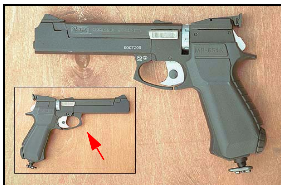
Рис. 1 Пневматический пистолет MP-651K. Вид слева и вид справа (указывает красная стрелка)

Допустим, вы решили купить пневматический пистолет для развлекательной стрельбы. Выбор осложняется огромным ассортиментом "пневматики" в оружейных магазинах.