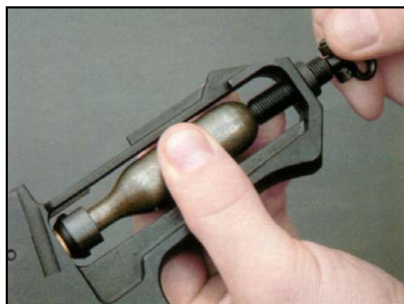
Рис. 5 Основная масса пистолетов изготавливается под недорогой отечественный баллончик CO 2 . Процедура установки баллончика проста и не занимает много времени.

Выступающий барабан несколько портит внешний вид, но не влияет на боевые качества оружия. Вызывает нарекания и пластмассовая прицельная планка - она боится ударов и немного мешает взводить курок. Но самое главное - невысокое качество сборки. Правда, эту проблему надо решать на уровне национального менталитета, а не в рамках кон-